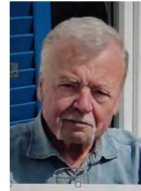
Euer Schießleiter und Waffenwart

immer gut Schuss, Erfolg und viel Gesundheit für das Jahr 2025